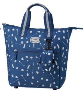
NVY : ネイビー