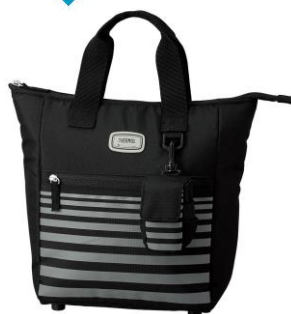
BK : ブラック