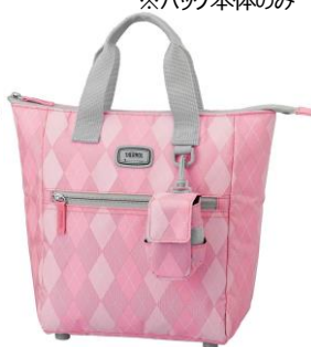
P : ピンク