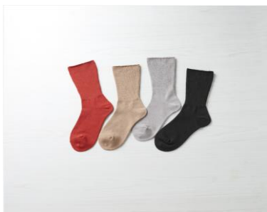
④締め付けないあったかソックス クルー丈 (AL-C401G)