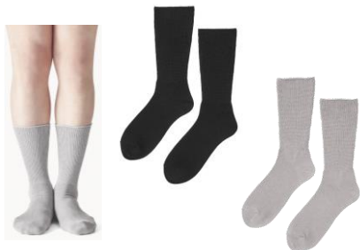
⑤締め付けないあったかソックス クルー丈 (AL-C401B)