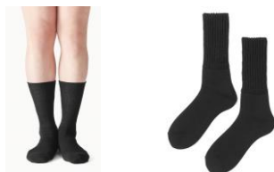
②起毛であったかルームソックス ミドル丈 (AL-C402B)