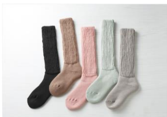
③起毛であったかルームソックス ロング丈 (AL-C403G)