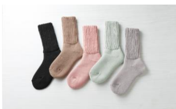
①起毛であったかルームソックス ミドル丈 (AL-C402G)