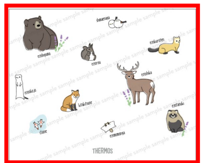
発売決定デザイン！