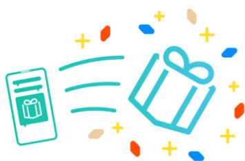
サーモスオンラインショップの eギフトサービス