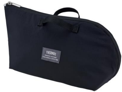
RFH-001 左から MNT : ミント、SDBE : サンドベージュ