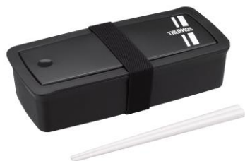
DJS-701 BKSL : ブラックシルバー