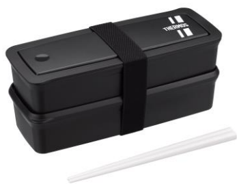
DJS-981W BKSL : ブラックシルバー